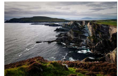
Portmagee Cliffs am Ring of Kerry (Foto: Enrico Strocchi)

In Irlands Hauptstadt stehen zwei sehr unterschiedliche Gärten auf unserem Programm, bevor wir uns auf den Weg quer über die Insel bis zur Südwestküste machen, wobei wir links und rechts des Weges einige Gärten anschauen werden. Im Südwesten ist das Klima dank des Golfstromes besonders mild, und neben Gärten mit subtropischen Pflanzen gibt es eine fantastische Landschaft zu bestaunen. Zurück geht es auf demselben Wege.