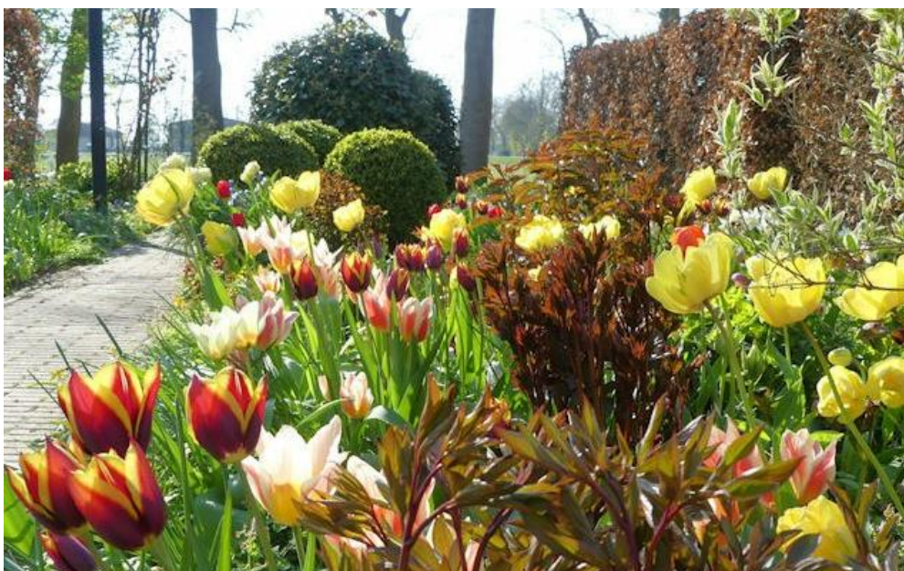
Garten Lipkje Schat

Anmeldung: Schmäetjen-Reisen, 0 42 88 - 2 34 und 13 53, reise@schmaetjen.de