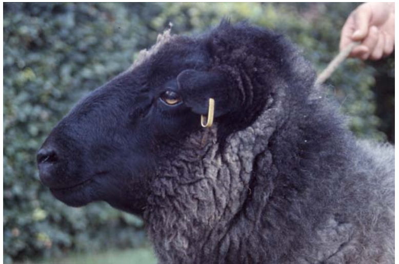
Edler Kopf des Rauhwolligen Pommerschen Landschaf-Bockes Hans