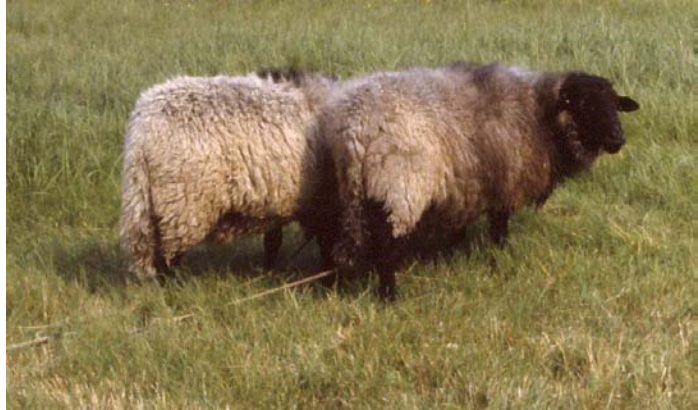
Rauhwollige pommersche Landschafe am Tüder

Als typisches Schaf der kleinen Leute wurden die Tiere selten in größeren Beständen gehalten. Die Produkte des Rauhwolligen Pommerschen Landschafes (Wolle, Fleisch und Dung) ergänzten die kleinbäuerliche Wirtschaft der Büdner und Fischer. Oft wurden die Schafe in Ermangelung eigener Weideflächen am Wegrand getüdert. Diese Haltung, bei der zwei Tiere an einer gemeinsamen Kette an einem Pflock befestigt sind, ist noch heute anzutreffen.